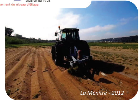
La Ménittré - 2012

Afin de prévenir un développement excessif de la végétation, l'État entretient le lit de la Loire.