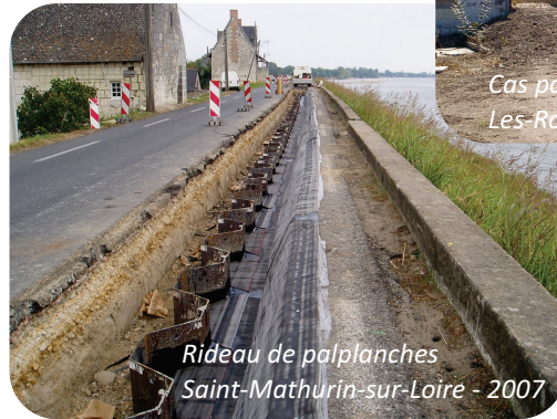
Rideau de palplanches Saint-Mathurin-sur-Loire - 2007