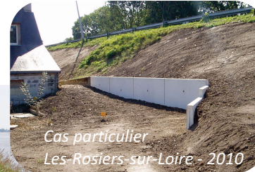
Cas particulier Les-Rosiers-sur-Loire - 2010

Ces interventions ont été réalisées sous maîtrise d'ouvrage de l'État, propriétaire des digues, avec le concours financier de la Région Pays-de-la-Loire et du Conseil général de Maine-et-Loire.