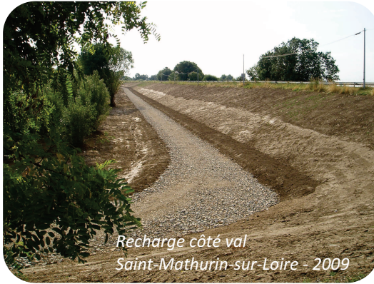
Recharge côté val Saint-Mathurin-sur-Loire - 2009

Ces renforcements de corps de digue ont été réalisés en employant deux techniques différentes : par création d'un voile étanche par la mise en place de rideaux de palplanches et par épaississement côté val.