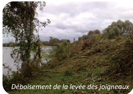
Déboisement de la levée des joigneaux

Dans la continuité des plans Loire précédents, le déboisement des levées a été poursuivi sur environ 13 km sur les communes de Beffes, Marseilles-les-Aubigny, La-Chapelle-Montlinard, Léré, Cuffy et Cours-les-Barres, ce qui a permis d'achever le déboisement des levées du Cher.