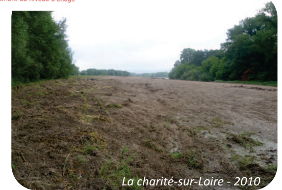
La charité-sur-Loire - 2010

Afin d'enrayer ce phénomène, l'État, avec l'aide financière des Régions Centre et Bourgogne, restaure le lit de la Loire.