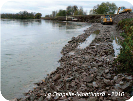
La Chapelle-Montlinard - 2010

Ces travaux se sont accompagnés de la réalisation d'un chemin de service en pied de levée côté Loire, permettant une surveillance et un entretien mécanisés de l'ouvrage.