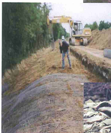
Lutte contre les animaux fouisseurs 0,1 M€