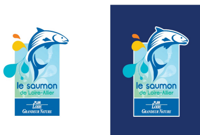
Illustration 4: Bloc-marque du plan de communication du saumon

En 2012, le bureau d'étude Markedia a développé le bloc marque et la charte graphique ci-dessous pour le plan de communication du saumon.