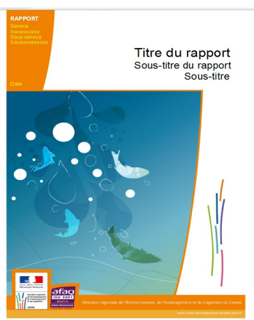
Illustration 3: Charte graphique de la Stranapomi

Le ministère en charge de l'écologie pour la Stranapomi a développé une charte graphique. Quelques éléments sont représentés ci-dessous.