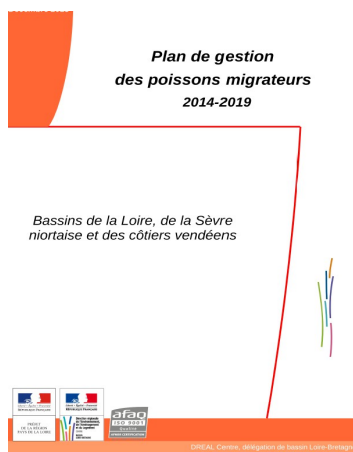
Illustration 2: Charte graphique du Plagepomi

La charte graphique adoptée pour le Plagepomi 2014 -2019 correspond à la charte graphique utilisée par le ministère en charge de l'écologie pour tous les sujet biodiversité-eau.