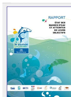
Illustration 5: Charte graphique du plan de communication du saumon